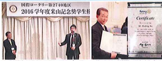
奨学生とカウンセラーのスピーチ 修了証と感謝状 頂きました！