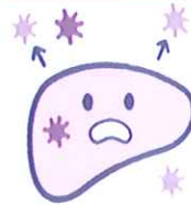
ウイルスを体の中から排除して治療します