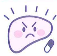
肝臓の炎症を抑え、肝炎の悪化や進展を予防します