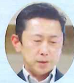
ニコニコ発表 宮崎会友

西岡: 琴海ロータリーの皆様、本日はようこそおいで下さいました。どうぞごゆっくりお過ごし下さい。