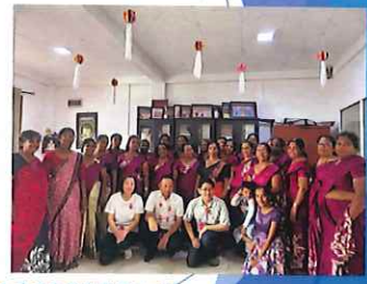
スリランカの女性自助グループ「ディリ・ララナ」の皆さんと

基金設立の思いを実現し、ロータリー財団7つの重点分野のひとつである「地域経済の発展」に寄与させていただきたい。