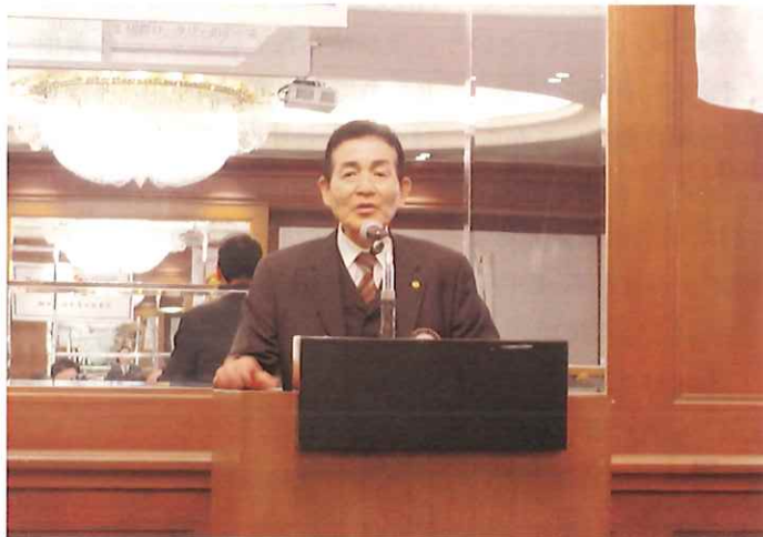
丸木会友が体調不良のため長年のロータリー生活を終了し1月末をもって退会されることを皆様に報告されました。「お世話になりました。ありがとうございました！」