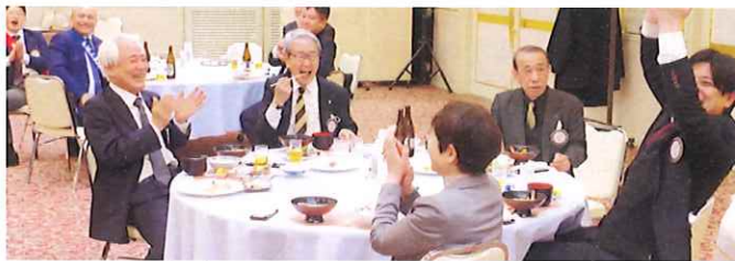
優勝チームは、1番テーブルでした。