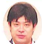
ニコニコ発表 井口会友