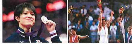
内村航平選手は2012年ロンドン大会で、1984年ロサンゼルス大会の具志堅幸司選手以来の個人総合優勝を飾った

1956年メルボルン大会で小野喬選手が初めてのメダルとなる銅メダルを獲得してから、日本の男子体操は1964年東京大会から1972年ミュンヘン大会まで個人総合3連覇を達成、複数の選手が表彰台に上るなどお家芸として大活躍を見せていました。