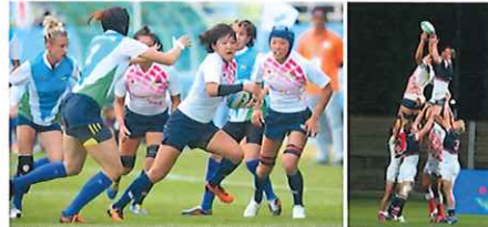
2016年リオデジャネイロ大会から正式競技になった7人制ラグビー

7人制ラグビーは、フィールドやボールの大きさ、得点配分は15人制と同じ、大きな違いは競技時間で、15人制は40分ハーフで試合を行います。7人制は7分ハーフ（大きな大会の決勝のみ10分ハーフ）で1日で試合をこなします。