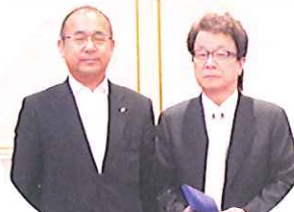
会長より記念品贈呈