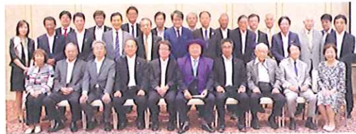
古稀を迎えられた辻村会友を囲んで