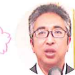
入会された榎屋会友挨拶