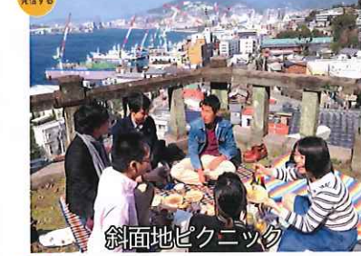
斜面地ピクニック