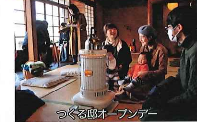
つくる邸オープンデー