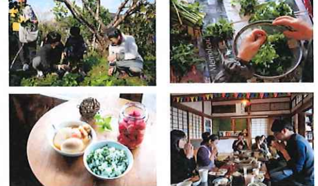
つくる邸オープンデー