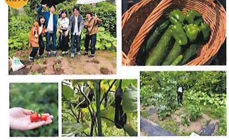
山手菜園 地域を深く知る・参加する