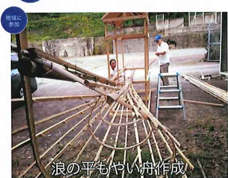
浪の平もやい舟作成