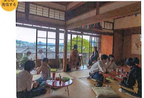
WEEKLY OPEN DAY 毎週水曜日12時~17時