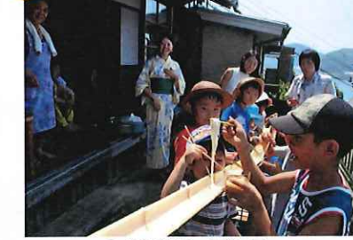
つくる邸オープンデー