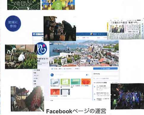
Facebookページの運営 「浪の平地区まちづくり協議会」