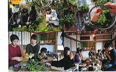
七草粥を食べる会