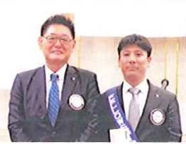
結婚記念日 6月30日 早崎会友