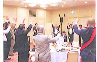
万歳三唱 猪股会友