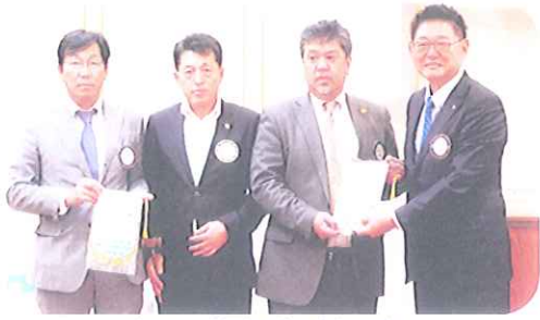
会長・幹事引き継ぎ式