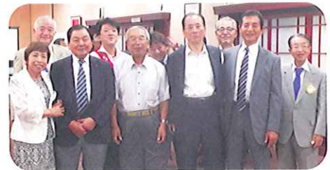
琴海RCの方々と一緒に