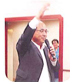
万歳三唱 猪股会友