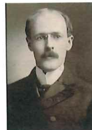
Paul Percy Harris 1868-1947