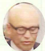
ニコニコ発表 森(正)会友

森(正):本日は50周年のリハーサルです！いい記念事業にしたいと思いますので、力を合わせて頑張りましょう！