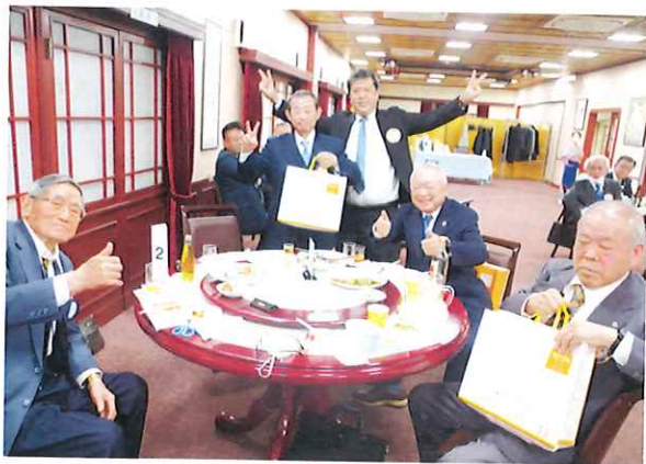
2番テーブルが優勝!!