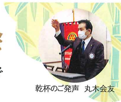
乾杯のご発声 丸木会友