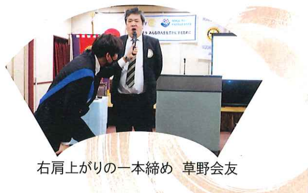
右肩上がりの一本締め 草野会友